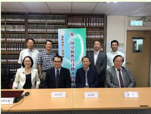
第三屆終選評審曾鈺成大紫荊勳賢、彭新強教授與 時任學會會長、主席於 2017 年 9 月 18 日合照