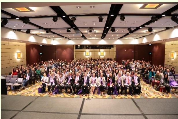
第四屆卓越教育行政人員獎勵計劃於 2020 年 1 月 11 日在香港會議展覽中心舉行頒獎典禮