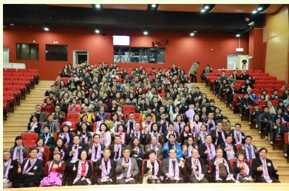
第三屆卓越教育行政人員獎勵計劃於2018年1月13日在耀中國際學校演奏廳舉行頒獎