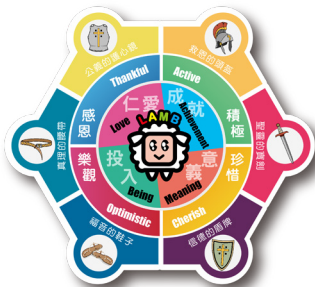
▲ 品格教育藍圖「基灣人」特質

為回應學生成長需要，過去品德教育在各組的實施欠系統及聚焦，學校近年積極推行「基灣·愛·小精兵計劃 VASE」，在品德教育進行革新。全體老師先進行集思會，結合辦學特色及過去的經驗，擬定「基灣人」的品格特質，將仁愛、成就、意義和投入的四個內在特質 (LAMB) 緊密結合進課程中，幫助學生建立正確的價值觀，促進全面發展。老師透過感恩、珍惜、積極和樂觀等生活態度的培養，在每堂課中不遺餘力，讓這些理念深入學生心中，結合宗教教育的屬靈軍裝，教導學生