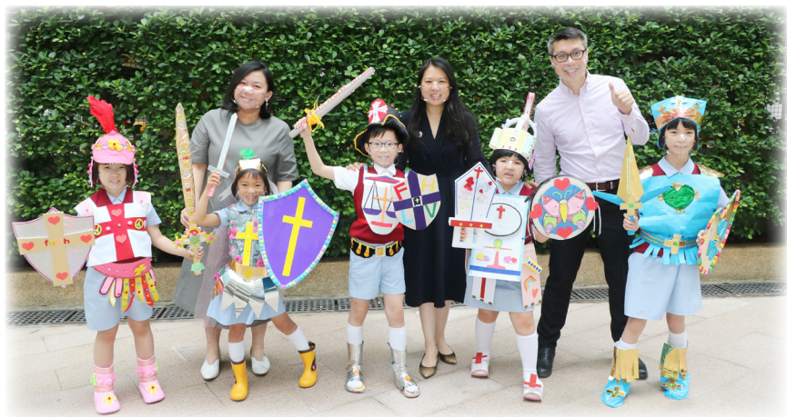
▲ 配合「基灣·愛·正向小精兵」計劃，學生自製「屬靈軍裝」，從中學習如何提升抗逆力，建立正向價值觀。

老師充分利用周會、生命教育課和戶外參觀，將計劃理念融入學習經歷中，又制定了獎勵計劃，幫助學生養成十個良好的生活習慣，培養正確生活態度。為達到理想的執行效果，全校老師均參加身心語言程式學 (NLP) 課程，讓教師們專業的知識設計課堂配合學習成長需要。每年我們都會進行檢討及前瞻會議，優化這個計劃的推行。